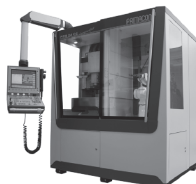
PFM 24 CC