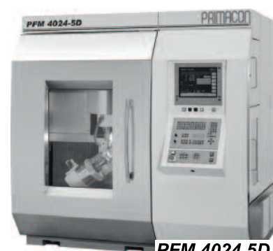
PFM 4024 5D