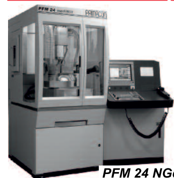
PFM 24 NGd